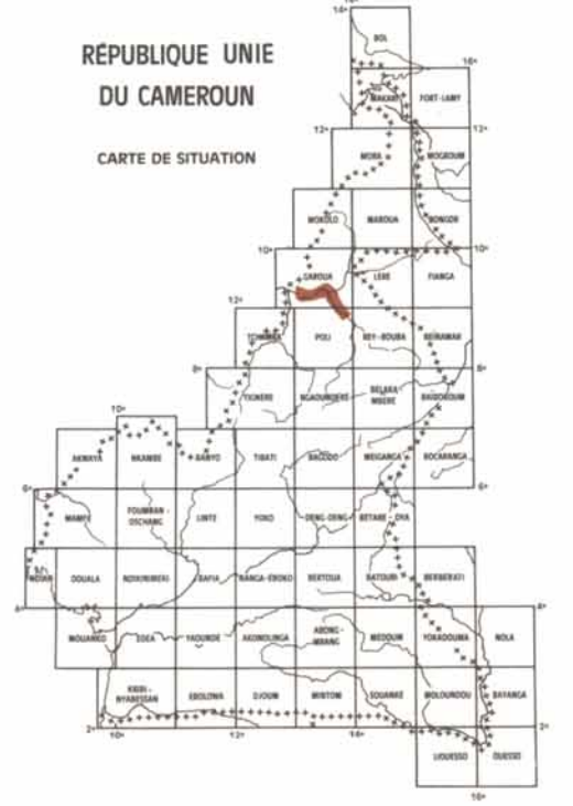
RÉPUBLIQUE UNIE DU CAMEROUN CARTÉ DE SITUATION