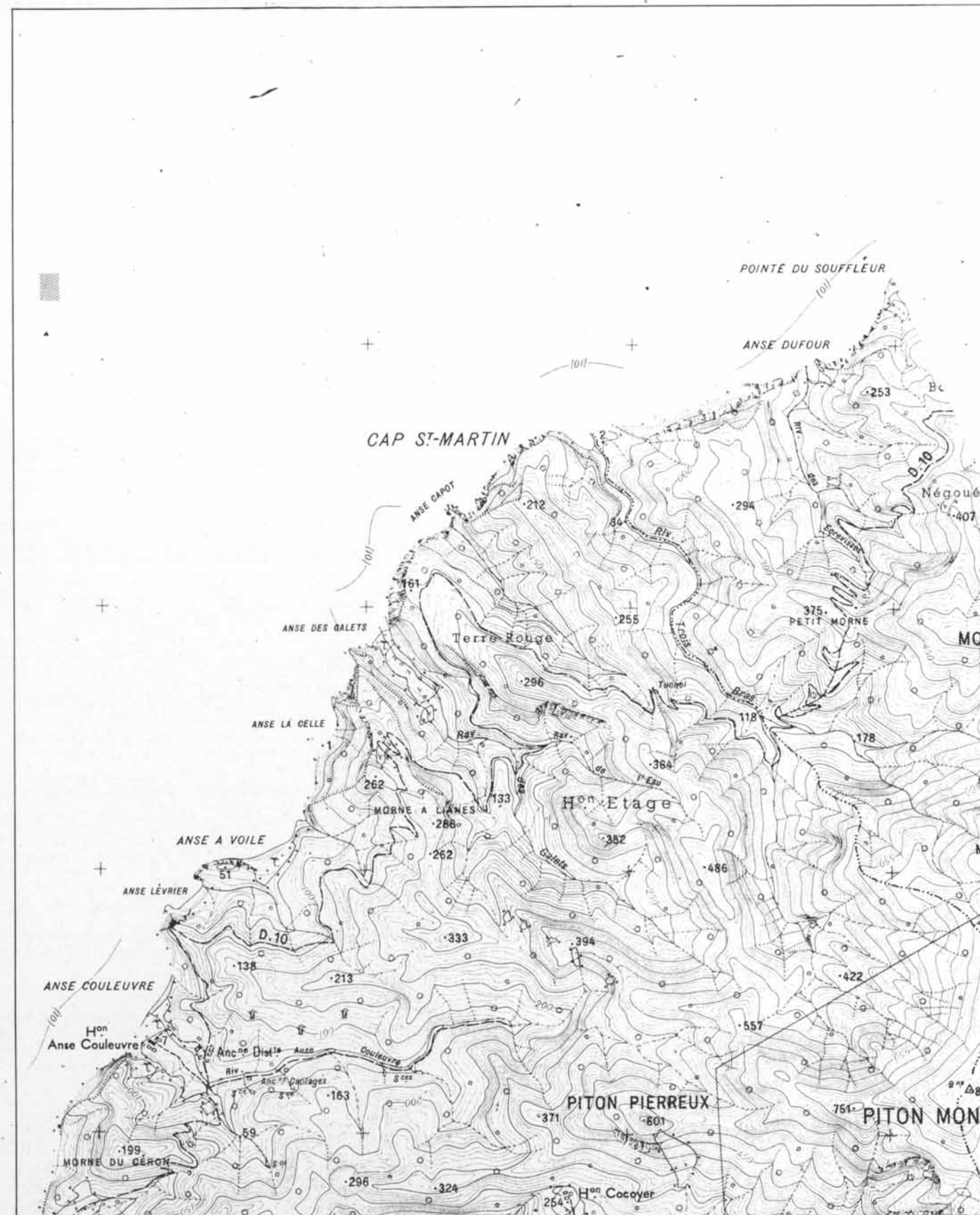
Cartes établies sous la direction de M. F. COLMET DAAGE

Interprétation des photographies aériennes en couleurs, mise au net des maquettes et dessin des cartes par M. J. BERNARD, avec la collaboration de A. PALLUD et A. POUMAROUX.